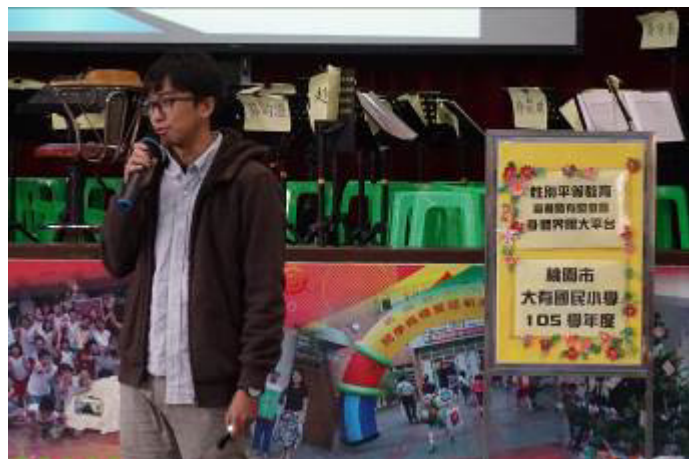
圖片說明:105/12/16 健康的兩性關係及身體自主權宣導