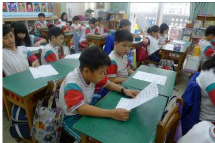
圖片說明:105/5/9 性別平等教育影片欣賞 ~性侵害防治教育