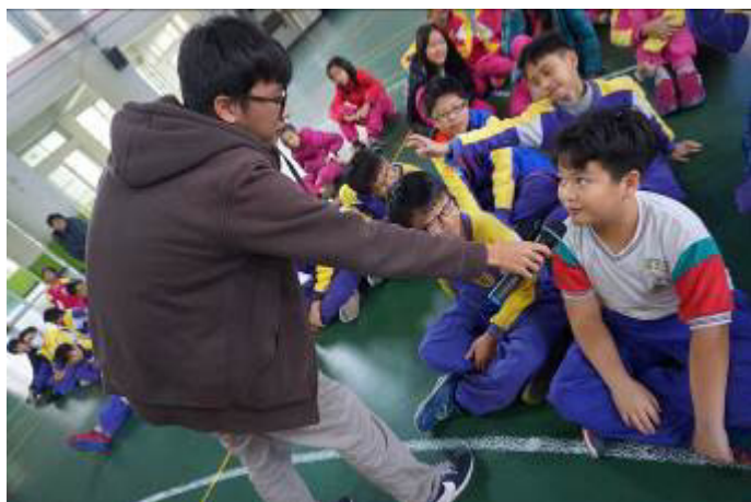
圖片說明:105/12/16 健康的兩性關係及身體自主權宣導