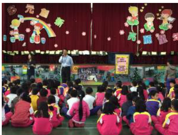
圖片說明:105/12/9 性別平等戲劇巡迴 宣導~保護自己尊重別人-淑女還是鐵 男