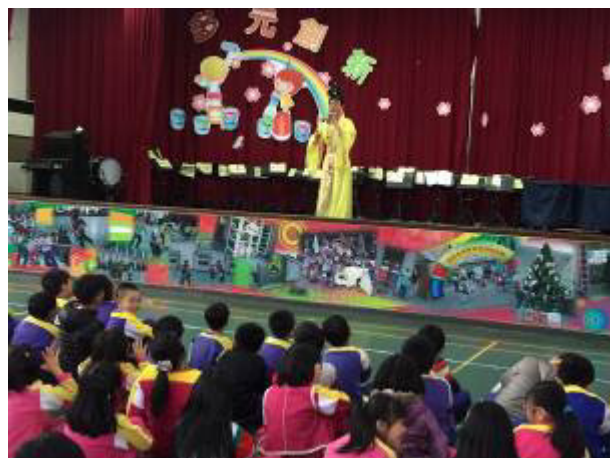
圖片說明:105/12/9 性別平等戲劇巡迴 宣導~保護自己尊重別人-淑女還是鐵 男