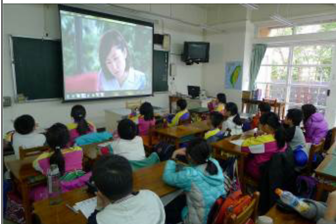
圖片說明:105/5/9 性別平等教育影片欣賞 ~~性侵害防治教育