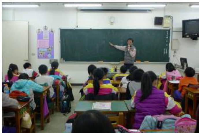
圖片說明:105/12/12 性別平等教育影片欣賞 ~以前都是這樣啊!~性別與文化