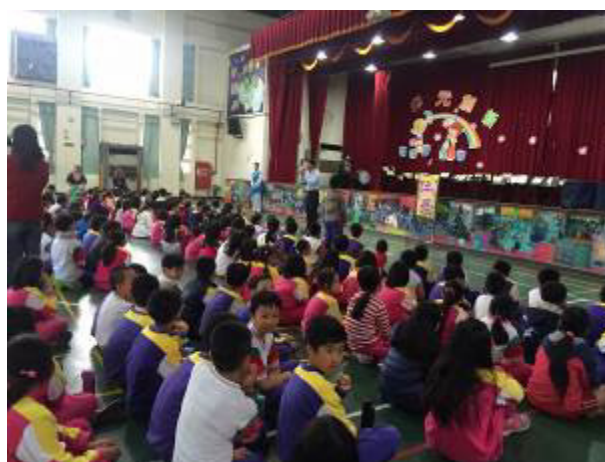
圖片說明:105/12/9 性別平等戲劇巡迴 宣導~保護自己尊重別人-淑女還是鐵 男